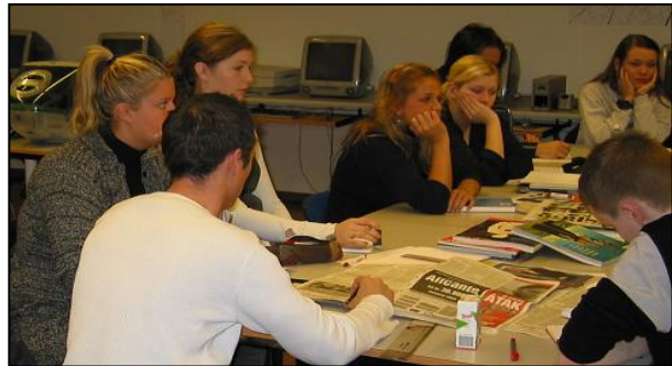
Skipuleg vinna sem skilar árangri!

Markmið ráðgjafarinnar er að veita nemendum þjónustu í málum sem tengjast námi þeirra, náms- og starfsvali og persónulegum högum. Þá veita náms- og starfsráðgjafar foreldrum, kennurum og öðru samstarfsfólki ráðgjöf í málum einstakra nemenda. Náms- og starfsráðgjafi er bundinn trúnaði við skjólstæðinga sína. Innan skólans er hann trúnaðarmaður og málsvari nemenda.